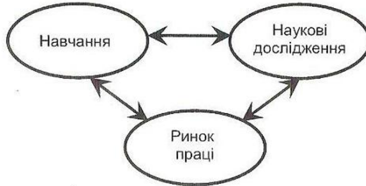
Рис. 1 Взаємозв'язок ключових інтегративних складових компетентнісного підходу

навчання, що забезпечує свідоме та міцне засвоєння системи знань, умінь і навичок у межах рівноправних взаємин учня (студента), учителя (викладача) та інформаційно-комунікаційного педагогічного середовища.